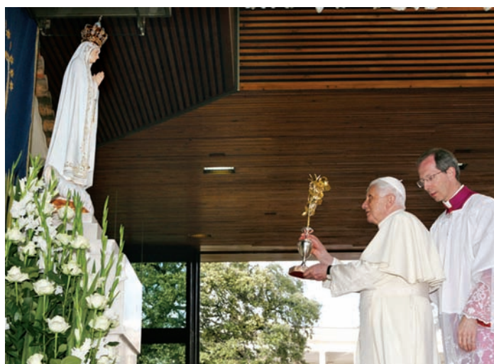
Papa Bento XVI entrega a Rosa de Ouro a Nossa Senhora de Fátima

geral é retirado da 2ª aparição de Fátima: O meu Coração Imaculado conduzir-vos-á até Deus. Trata-se de reafirmar que uma autêntica devoção a Maria aponta necessariamente para a centralidade de Deus na vida de todo o crente. Neste sentido, compreende-se que aprofundar a Mensagem de Fátima signifique percorrer aspectos importantes da fé cristã e (re)descobrir a beleza fascinante do amor de Deus.