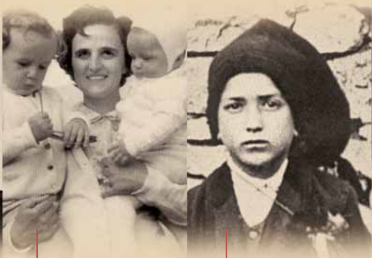
Gianna Beretta Molla