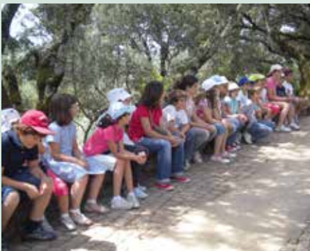
Klub Przyjaciół Pastuszków

Najtrudniej mówić o tym, co rodzi się z nami i towarzyszy nam od kołyski... Już nasi dziadkowie poznawali prawdy zawarte w orędziu fatimskim. To oni od dzieciństwa uczyli nas modlitwy. Słowa, które poznaliśmy jako dzieci, zostaną w nas na zawsze... Na przykład te, tak często przypominane, wypowiedziane przez papieża Jana Pawła II do dzieci 13 maja 2000 r. podczas beatyfikacji Franciszka i Hiacynty: