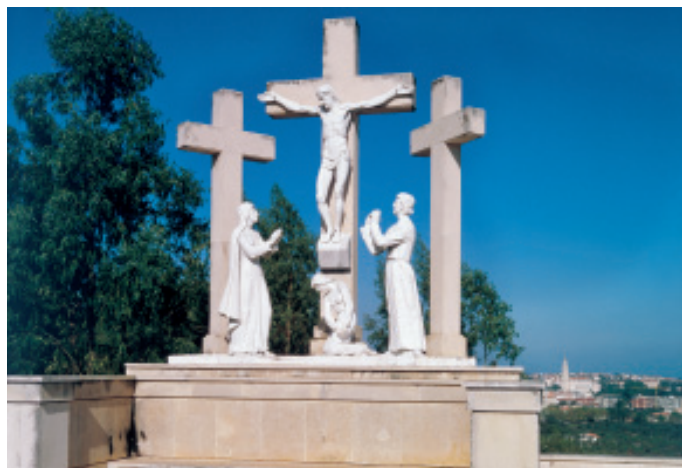
Fatima – Calvario Ungaro - Scena della crocefissione

La ricapitolazione della salvezza è la vittoria totale sul peccato, per l'umiliazione di Cristo sulla Croce.