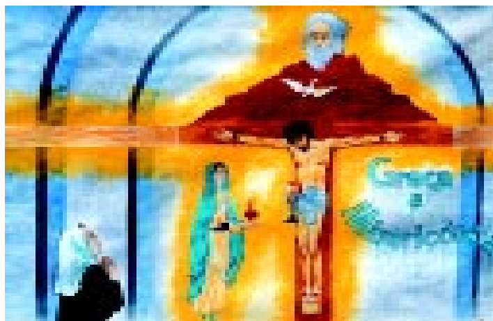
Tuy , 13 de Junho de 1929 – Visão da Santíssima Trindade

de «Luz tão intensa..., que penetrando-nos no peito e no mais íntimo da alma fazendo-nos ver a nós mesmos em Deus que era essa luz», os videntes rezaram intimamente: «Santíssima Trindade, eu Vos adoro. Meu Deus, eu Vos amo no Santíssimo Sacramento».